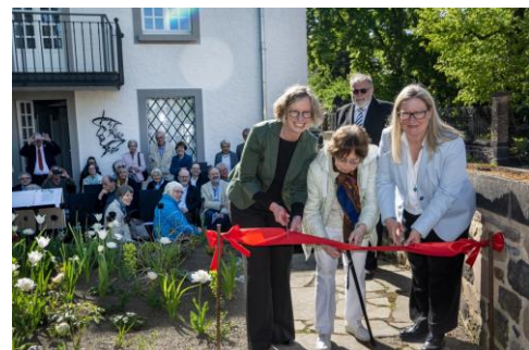
Feierliche Einweihung.