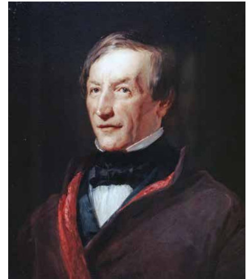
Peter Joseph Lenné (1789-1866) um 1850, C. J. Begas