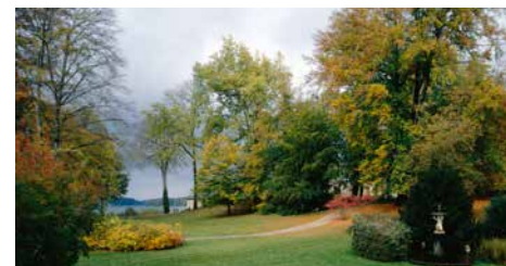
Blick vom Lenné-Hügel