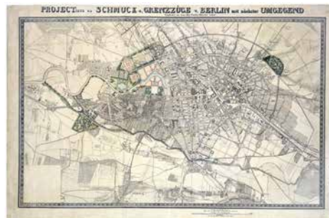
Lenné: Projektierte Schmuck- und Grenzzüge von Berlin und nächster Umgebung

Unter anderem Schöneberger Feldmark, Köpenicker Feld, Pulvermühlengelände, Schlächterwiesen (Urban), Feldmarken Charlottenburg & Lützow